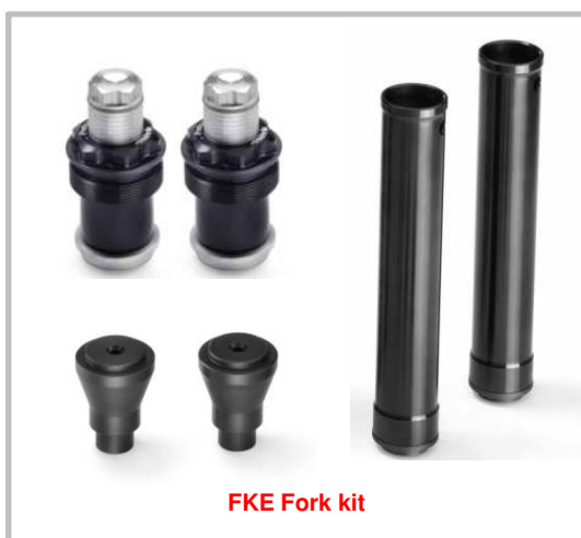
FKE Fork kit