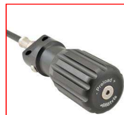
P2K Flex-Knob hydraulic spring preload